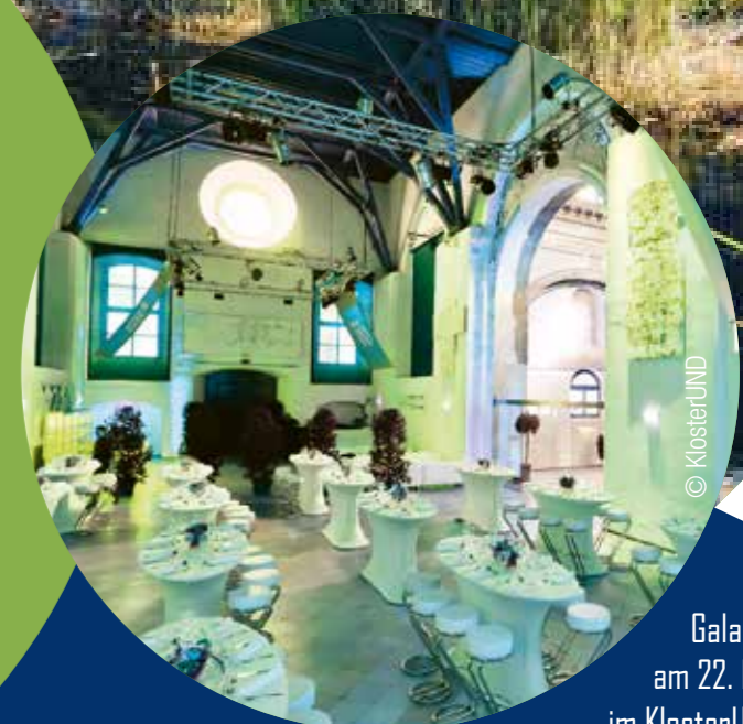
Gala-Abend am 22. Nov. im KlosterUND

Internationale Forschungs- und Technologietagung mit interaktivem Fachforum für PV-ExpertInnen, ArchitektInnen und PlanerInnen