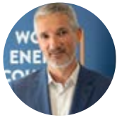
Christoph Frei World Energy Council