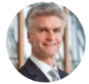
Hubert Cottogni Europäischer Investitionsfonds