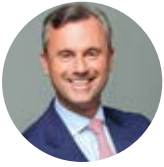
Norbert Hofer Bundesminister für Verkehr, Innovation und Technologie

»Die erste Mission Innovation Austria Week wird zeigen, dass Österreich schon heute Energietechnologien für den Weltmarkt und damit Lösungen für eine globale Energiewende bietet. Unsere Innovationslabore und Vorzeigeregionen zeigen wie es geht. Über internationale Forschungsk Kooperationen ebnen wir den Weg für österreichische Akteure und Unternehmen«