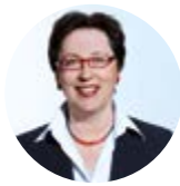
Theresia Vogel Klima- und Energiefonds