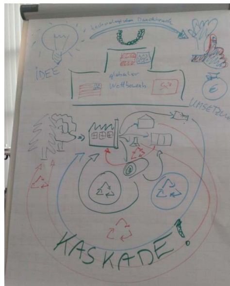
Beispiel Bild der Papier- und Zellstoff Gruppe