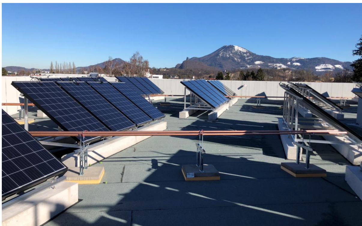
Abbildung 3 Kollektoren auf dem Dach des Gebäudes