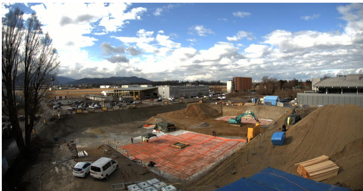
Abbildung 2 Verlegung des Erdspeichers