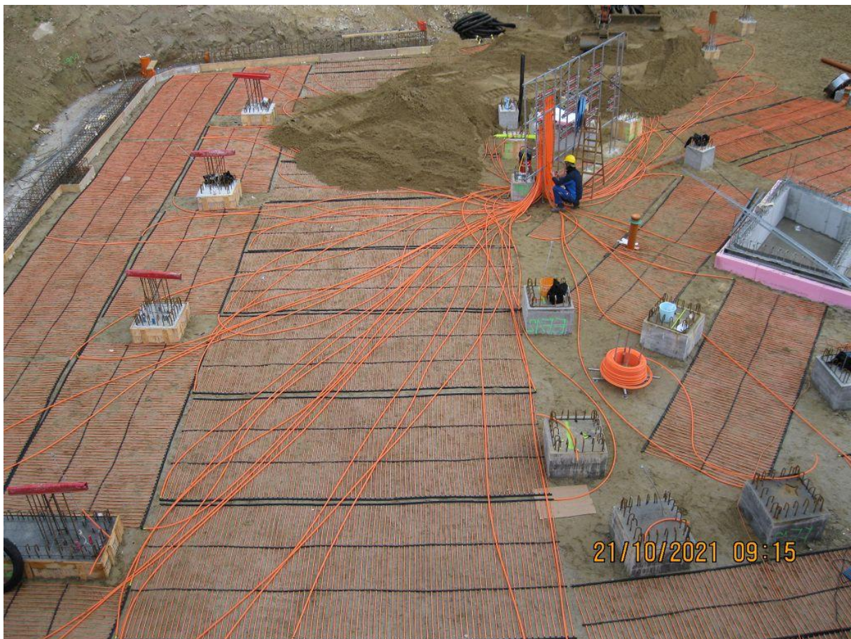
Abbildung 3 Verlegung des Erdspeichers