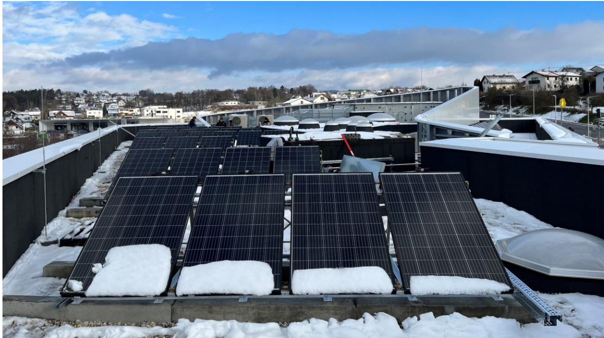
Abbildung 2 Solarthermieanlage auf dem Dach des Gebäudes