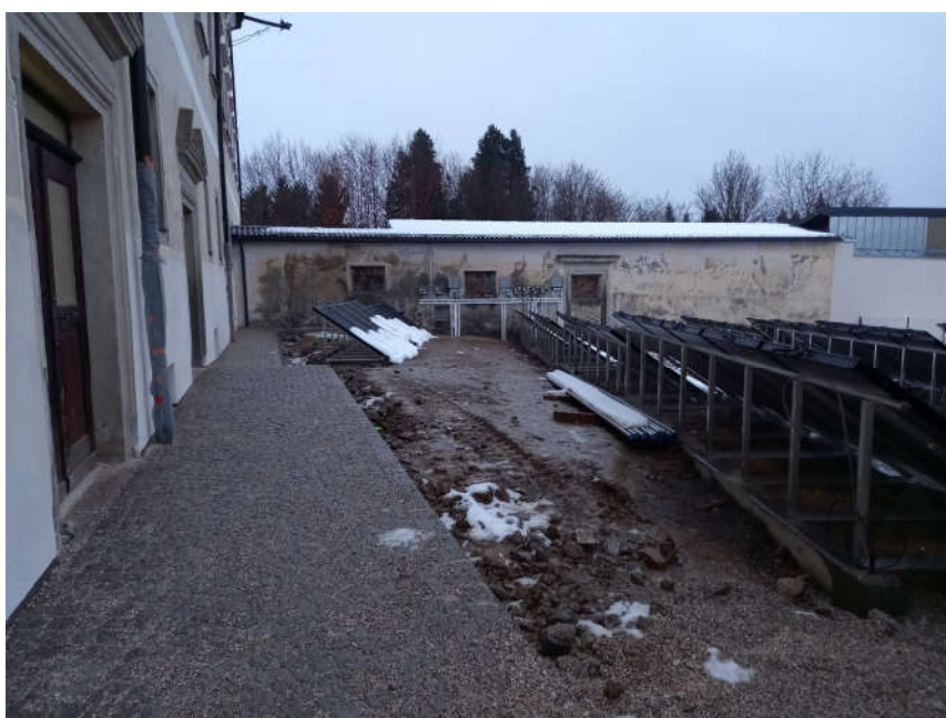
Abb. 05: rückseitige Ansicht der im Garten situierten Solar-Hybridkollektoren

Die Solar-Hybridkollektoren (Power-Pro) wurden auf Streifenfundamenten errichtet. Neigungswinkel und Ausrichtung wurden mit entsprechender Simulation ermittelt.