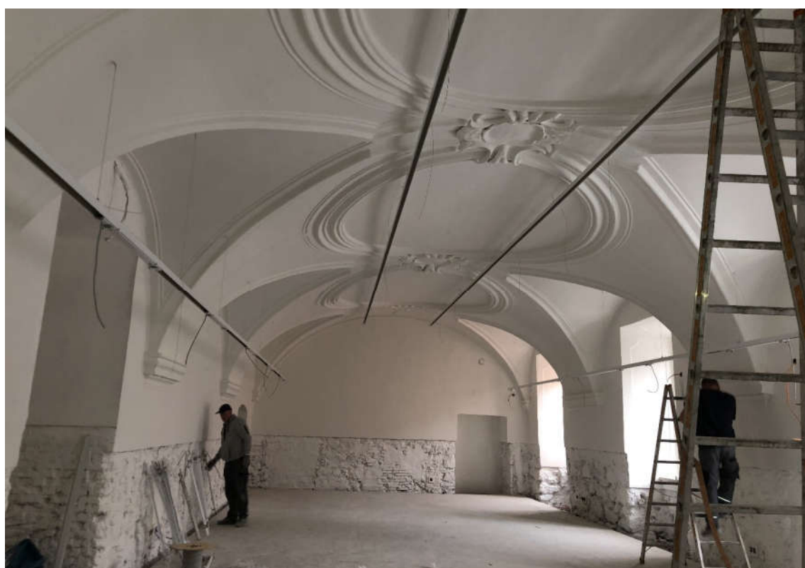
Abb. 03: Fertigstellungsarbeiten im repräsentativen Saal mit denkmalgeschützter Gewölbedecke

Nach Herstellung der massiven FB-Platte wurden die Wände mit speziellem Sumpfkalk (in Abstimmung mit BDA) gestrichen. Der augenscheinlich erkennbare Spalt zwischen Stahlbetonplatte und Mauerwerk ist als Verdunstungsstreifen (kapillare Feuchtigkeit) konzipiert. Dieser wird im Endausbau noch mit Grobkies verfüllt.