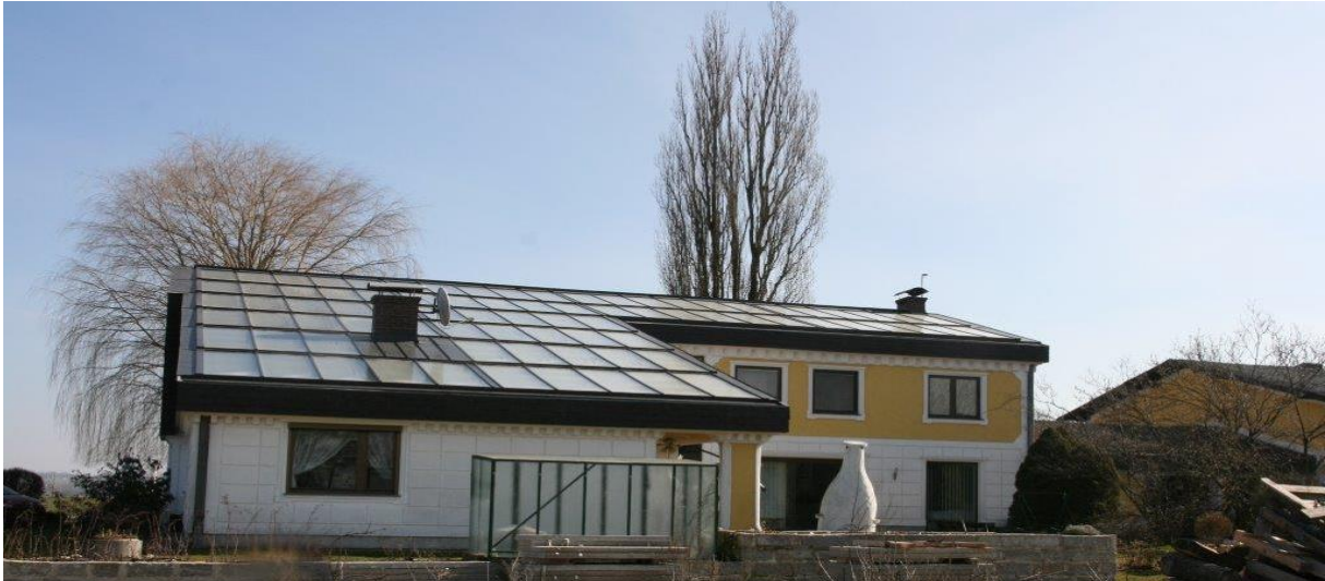
Abbildung 1: Ansicht des Wirtschaftsgebäudes bzw. des Kollektorfeldes der Anlage „Solare Trocknung Schickmaier“ (rechte Abbildung) sowie Ansicht des 30 m 3 Pufferspeichers während der Installation im Jänner 2015 (linke Abbildung) (Quelle: Schickmaier).