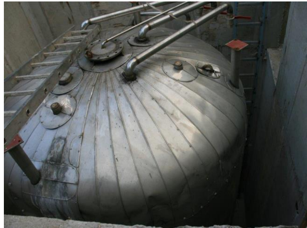
Abbildung 2: Darstellung des 30 m 3 Pufferspeicher während der Errichtung auf dem Betriebsgelände des landwirtschaftlichen Betriebs Schickmaier.