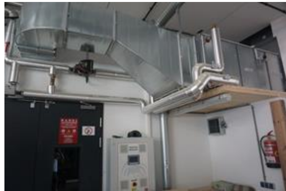
Abbildung 2: Lackierraum (links) und Lüftungsanlage (rechts) über welche der Lackierraum konditioniert wird