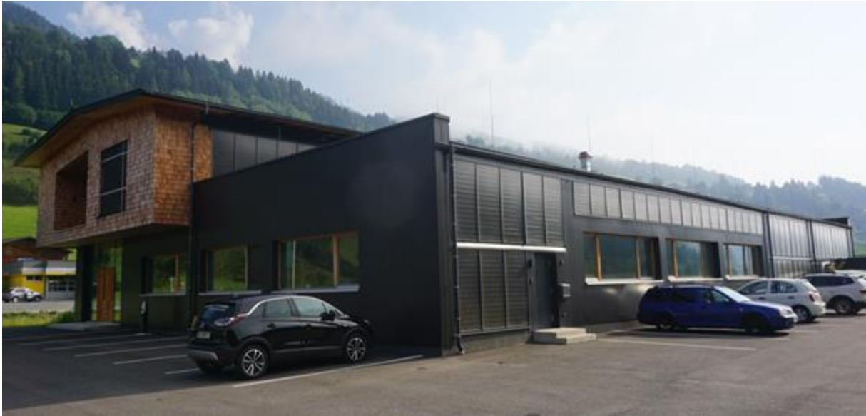
Abbildung 1: Südansicht der Tischlerei Gries – die Solaranlage ist in die Fassade im Erd- und Obergeschoß integriert