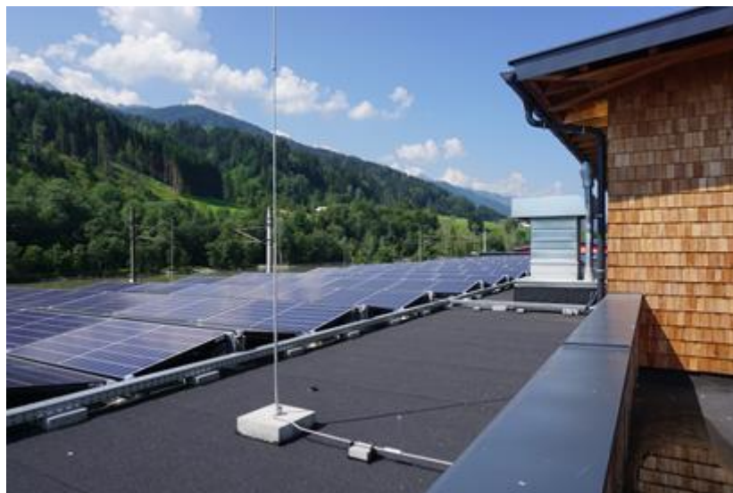
Abbildung 3: Am Flachdach der Werkstatt montierte 50 kWp PV-Anlage