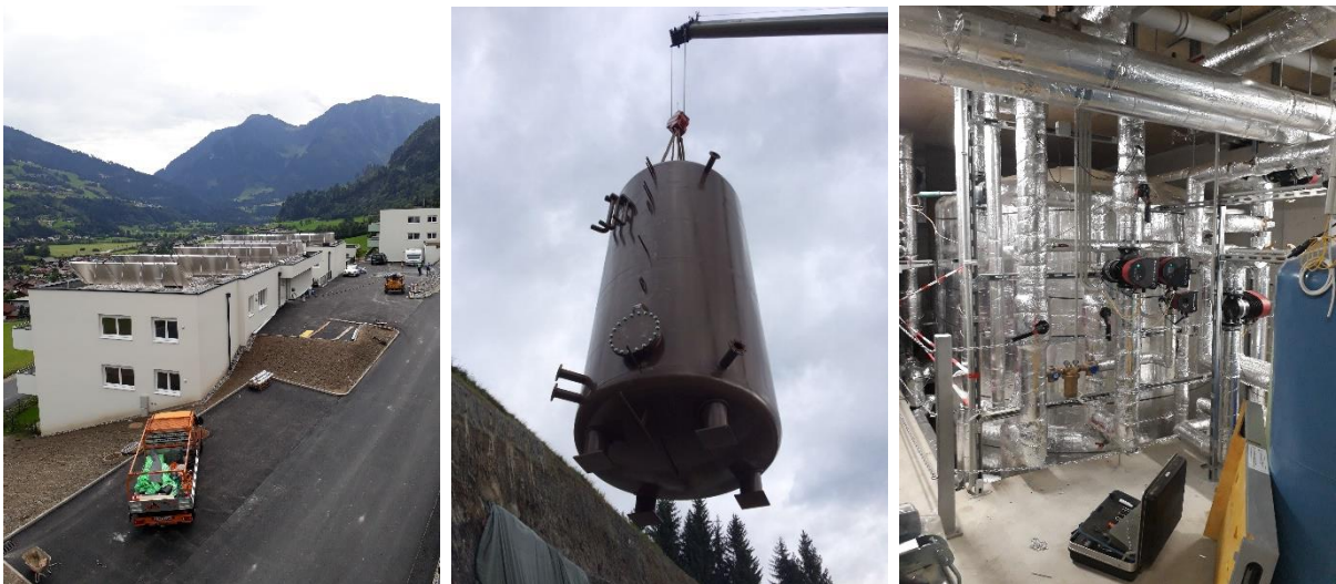
Abbildung 2: Beispiel einer Solarthermieanlage am Dach eines Wohnhauses (links), Pufferspeicher mit 30 m 3 Volumen während der Einbringung in die Heizzentrale (Mitte) und fertig eingebaut und isoliert (rechts).